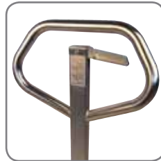
Die ergonomische Deichsel gewährt dem Anwender einen entspannten Griff.

Die Geräte entsprechen der Gerätegruppe II und sind für Bereiche zugelassen, die als Zone 1/Zone 21 klassifiziert sind (umfassen auch Zone 2/Zone 22). Das heißt Bereiche, in denen zu rechnen ist, dass eine gefährliche, explosionsfähige Atmosphäre durch ein Gemisch aus Gasen oder durch Staub gelegentlich auftritt.