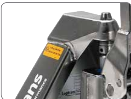
Die ex-geschützten Geräte sind für die Pharmaindustrie, sowie die Farben-, Öl- und Gasindustrie gut geeignet.

II 2G Ex h IIB T6 Gb II 2D EX h IIB T85°C Db