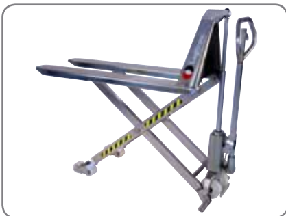
Die Standard-Geräte sind manuell und aus rostfreiem Stahl hergestellt.

Die explosionsgefährdete Ausführung ist mit der folgenden Produktkennzeichnung versehen: