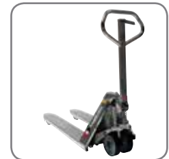
Die robuste Konstruktion garantiert eine lange Lebensdauer und niedrige Wartungskosten.