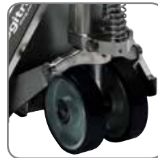
Die Geräte haben zwei anti-statische Vulkollan-Räder, um elektrostatische Aufladung zu vermeiden